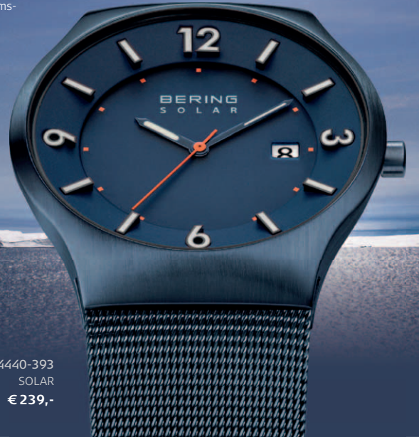
14440-393 SOLAR €239,-

Modelle mit: Edelstahl-Gehäuse, Saphirglas, Datumsanzeige, Milanaisband