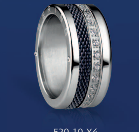
520-10-X4 551-70-X1 556-17-X1 Edelstahl, SWAROVSKI ELEMENTS € 109,90