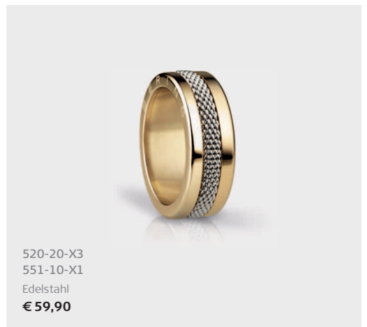
520-20-X3 551-10-X1 Edelstahl €59,90