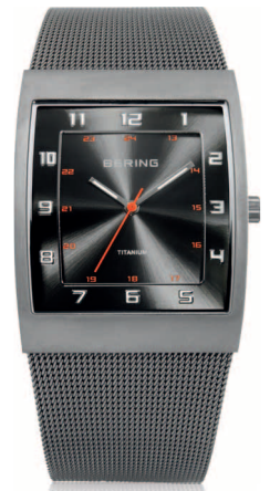
11233-077 Gehärtetes Mineralglas € 189,-