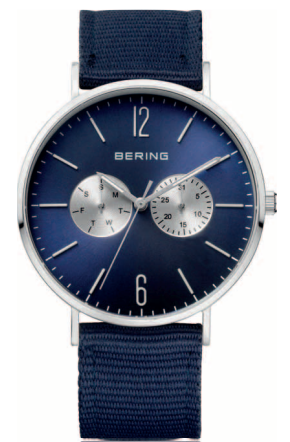
14240-507 Sunray-Zifferblatt, inklusive hochwertigem Leder-Wechselband € 179,-

Modelle mit: Edelstahl-Gehäuse, Hightech-Keramik, kratzfestem Saphirglas, Perlmutter-Zifferblatt, anschiessbarem Milanaiseseband