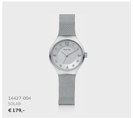
14427-004 SOLAR €179,-