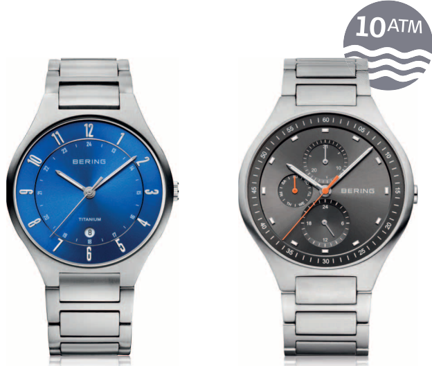
11739-707 FULL TITANIUM € 189,-