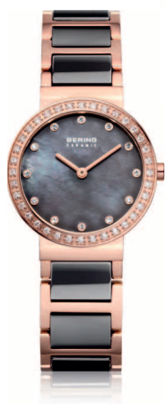
10729-769 Perlmutter-Zifferblatt €299,-