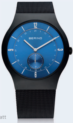
11940-227 Sunray-Zifferblatt €149,-