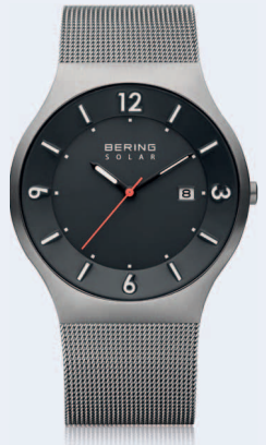
14440-077 SOLAR €199,-