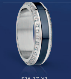
526-17-X3 554-70-X1 Edelstahl, Keramik, SWAROVSKI ELEMENTS € 129,90

Uhr mit: Edelstahl-Gehäuse, Saphirglas, Sunray-Zifferblatt, Milanaiseseband