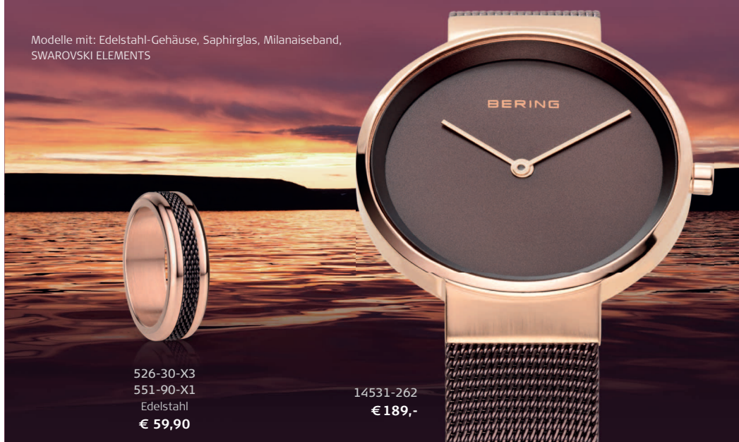
526-30-X3 551-90-X1 Edelstahl € 59,90

Modelle mit: Edelstahl-Gehäuse, Saphirglas, Milanaiseseband, SWAROVSKI ELEMENTS