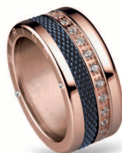
520-30-X4 551-70-X1 556-37-X1 Edelstahl, SWAROVSKI ELEMENTS € 129,90