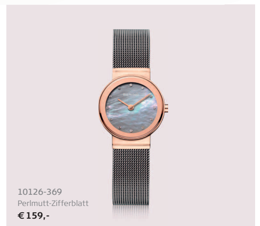
10126-369 Perlmutter-Zifferblatt € 159,-