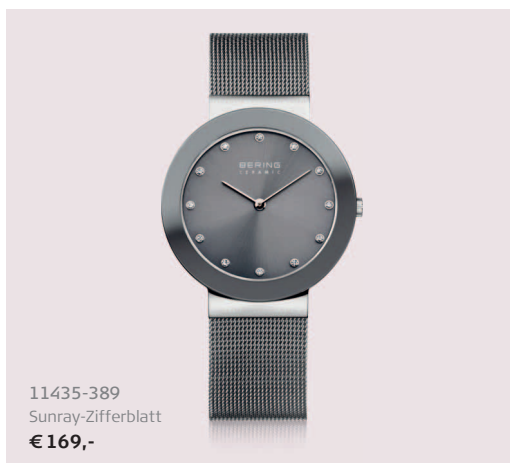
11435-389 Sunray-Zifferblatt € 169,-