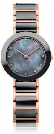
11429-769 Perlmutter-Zifferblatt €249,-