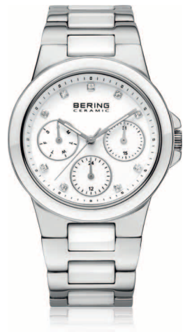
32237-754 Multifunktion €229,-