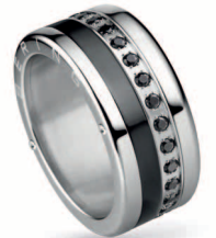
520-10-X4 554-60-X1 556-16-X1 Edelstahl, Keramik, Zirkonia €119,90